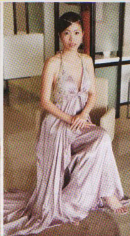
拥有浓厚复古色彩的紫色入脚晚装，充满着女人妩媚的风情。