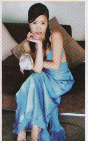
蓝色晚礼服适合皮肤白皙的我，选择长尾裙可以让我看起来更高挑。