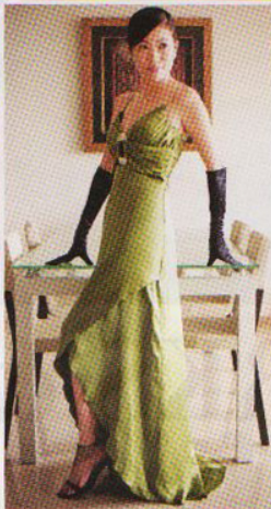
低调奢华的橄榄绿礼服，重点设计在于钻石扣，简单中突显优雅气质。