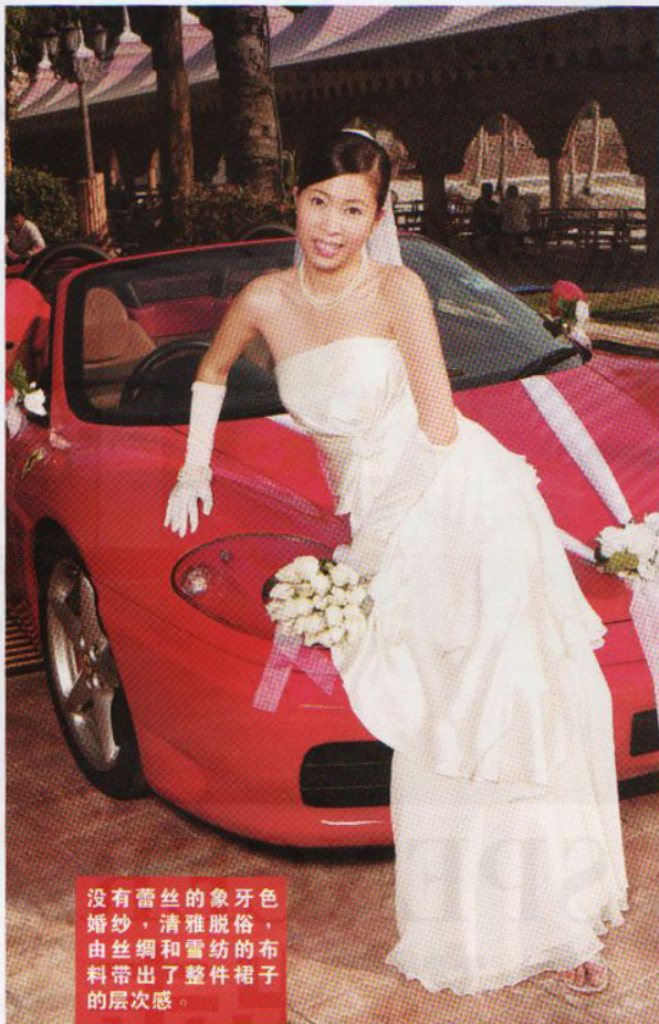
没有蕾丝的象牙色婚纱，清雅脱俗，由丝绸和雪纺的布料带出了整件裙子的层次感。